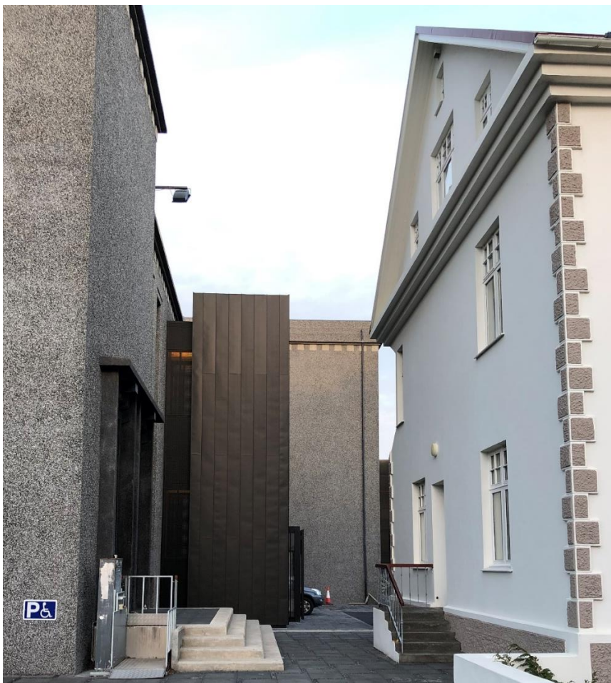
Mynd 1. Ný utanáliggjandi lyfta á Þjóðleikhúsinu séð frá Hverfisgötu