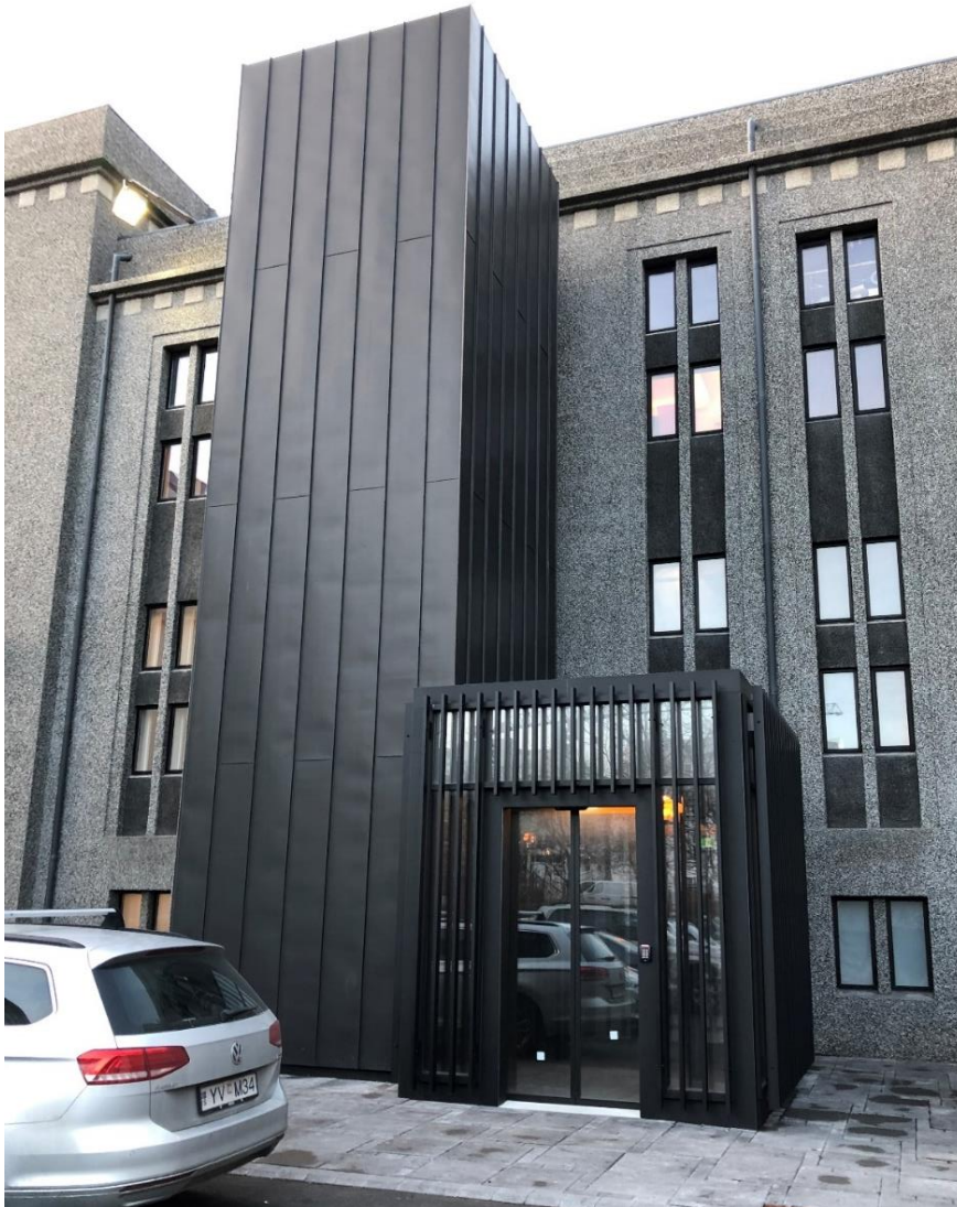
Mynd 3. Ný utánaliggjandi lyfta og anddyri á Þjóðleikhúsinu