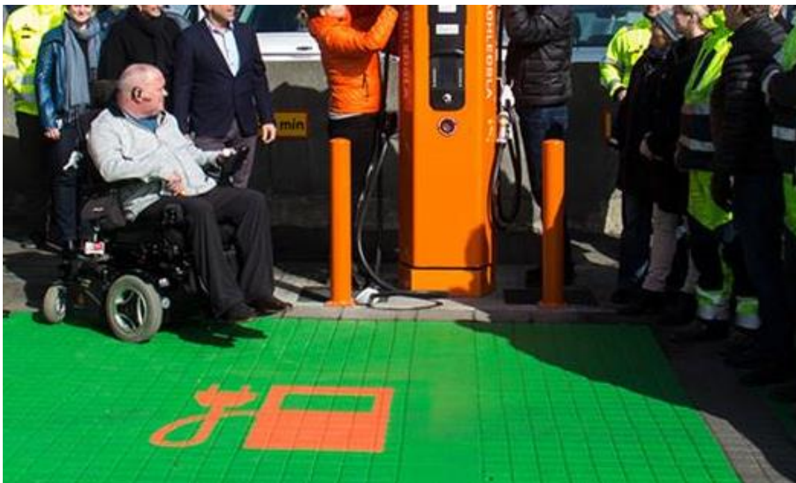
Mynd 21. Dæmi um hleðslustöð við bílastæði hreyfihamlaðra. Hér er ágætis aðgengi að hleðslustöð en stæðið er heilmálað og það vantar merki bílastæða hreyfihamlaðra á bláum fleti