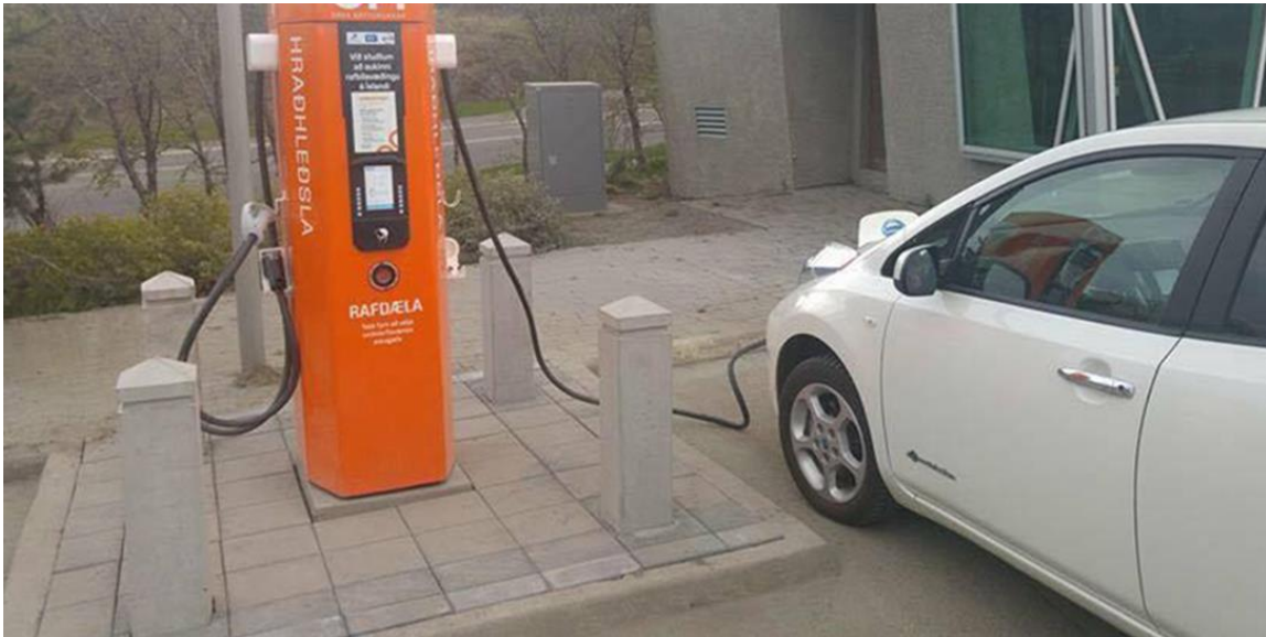
Mynd 2. Slæmt dæmi um hleðslustöð við bílastæði hreyfihamlaðra, háir kantsteinar hindra aðgengi