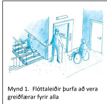
Mynd 1. Flóttaleiðir þurfa að vera greiðfærar fyrir alla

Til að útskýra orðið notkunareining er vísað í skilgreiningu á orðinu notaeining en það er skilgreint í staðlinum ÍST 51:2001 (gr. 2.10) sem: